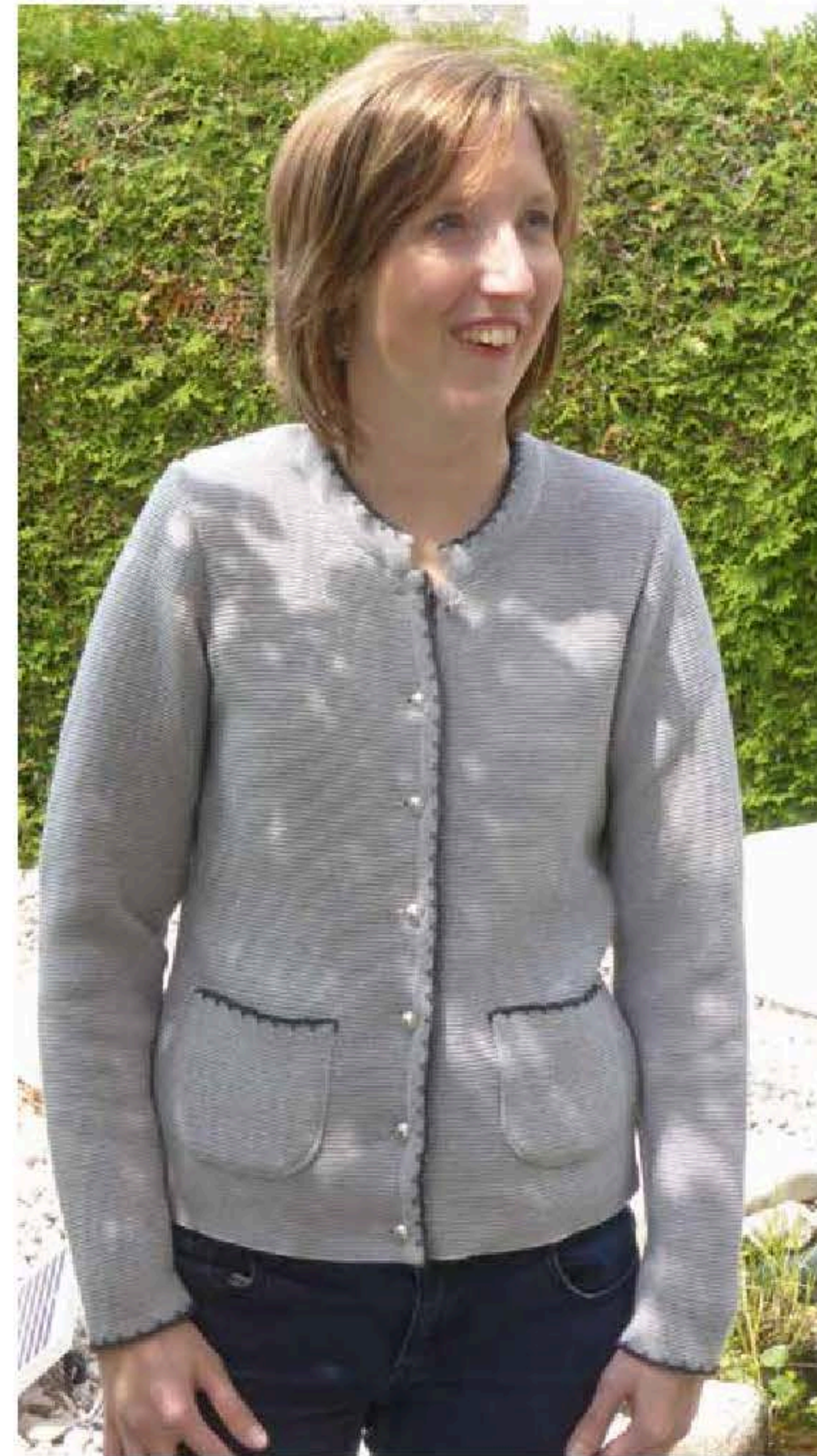
Damenjacke Carola Art.-Nr. 80110