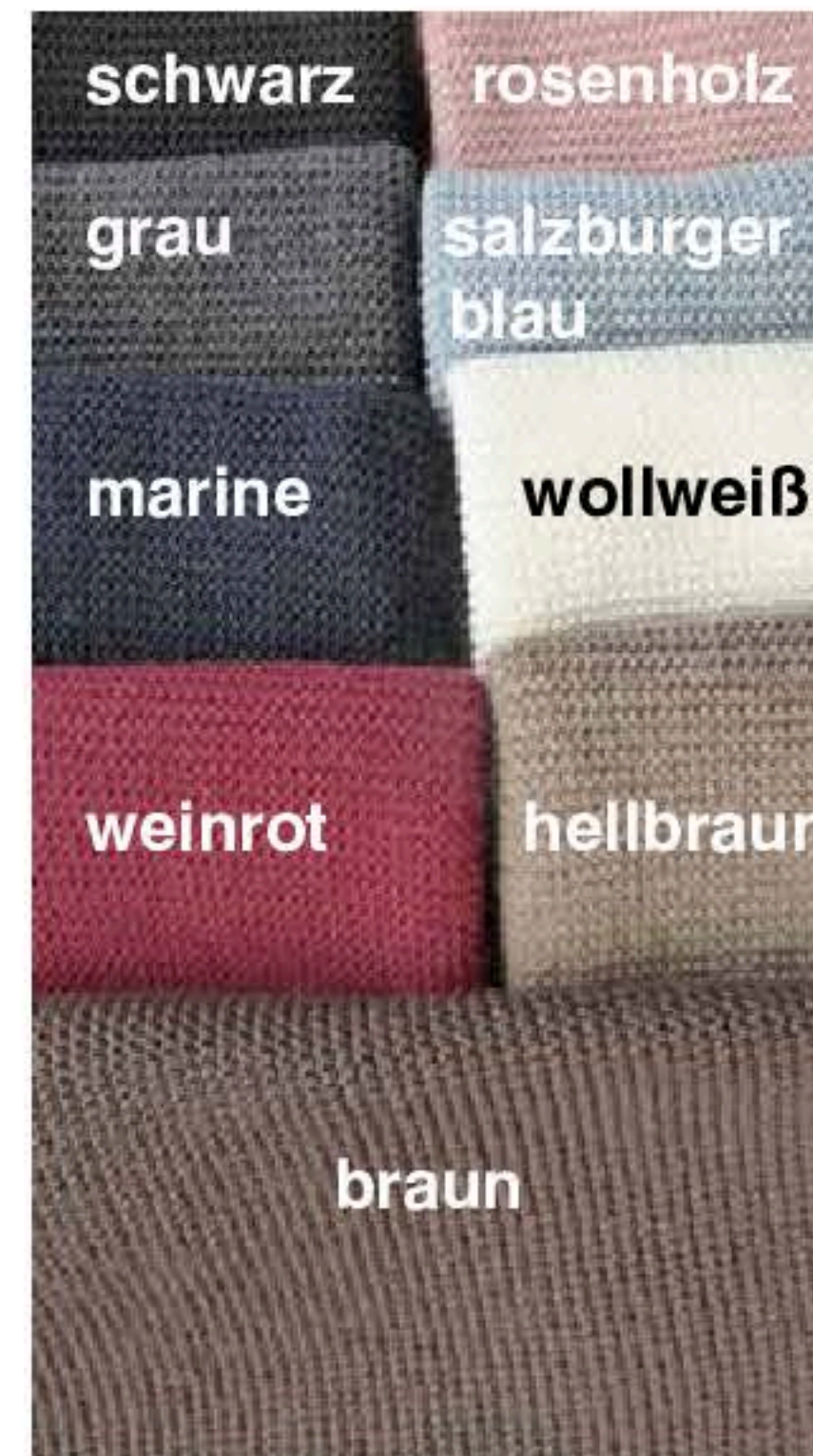
Damenjacke Rosi Art.-Nr. 80100