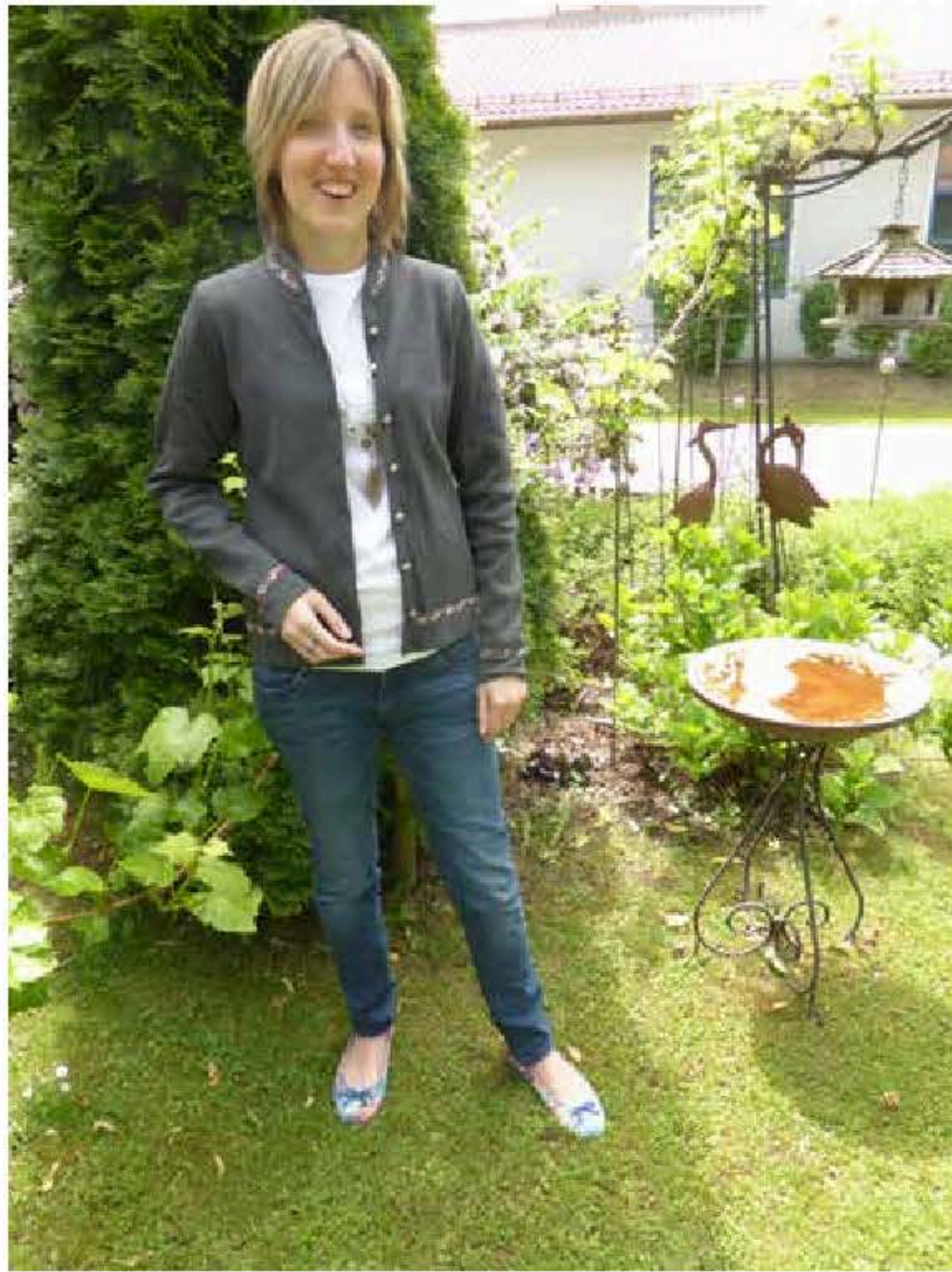
Damenjacke Regine Art.-Nr. 85108